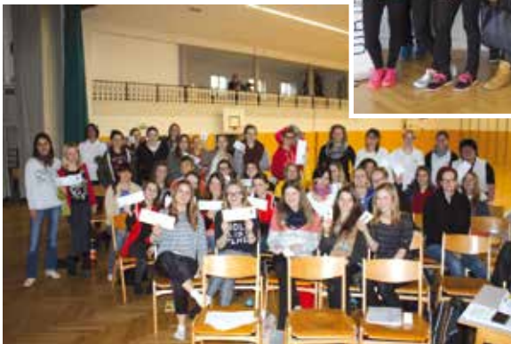
Die erfreuten Gesichter über die bestandene Prüfung mit ihren Ausweisen