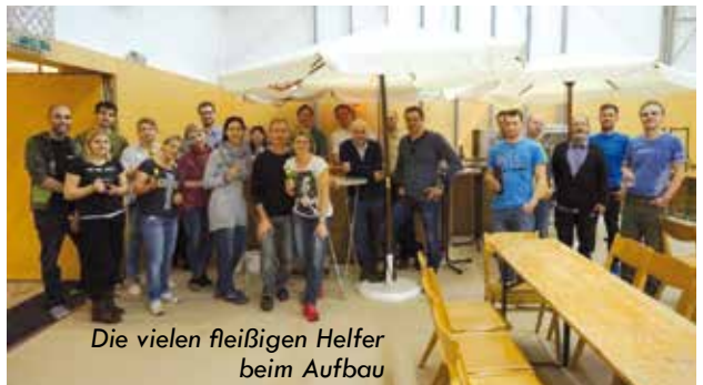
Die vielen fleißigen Helfer beim Aufbau