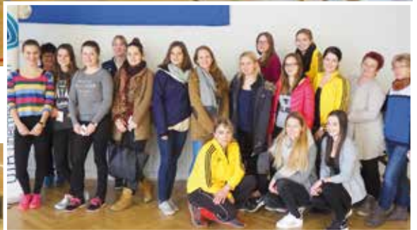
Die frisch gebackenen Oberstufenkampfrichterinnen.