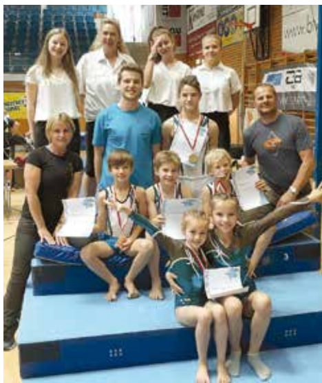
Akteure, Kampfrichter und Betreuer