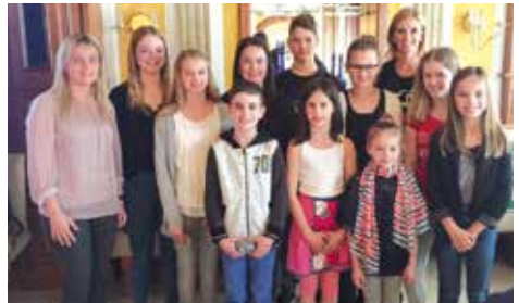
Ehrung für sportliche Leistungen 2017