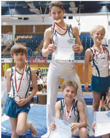
Wettkämpfer, super geturnt!

Am Sonntag durften dann auch die KunstturnerInnen ihre Landesmeisterschaft austragen. Und auch hier gibt es dank der großartigen Leistungen der Vöcklabrucker TurnerInnen stolze Erfolge für unseren Verein zu vermelden: