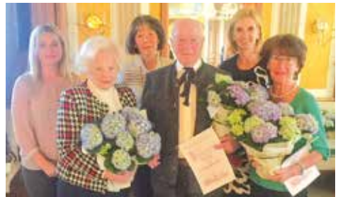
Gratulation zu 50 Jahren Mitgliedschaft