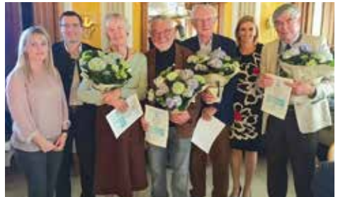
Gratulation zu 25 Jahren Mitgliedschaft