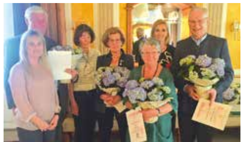
Gratulation zu 60 Jahren Mitgliedschaft